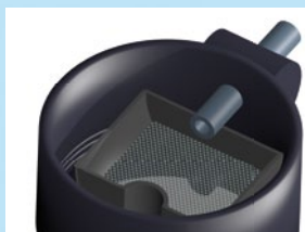
Module filtre en polyéthylène