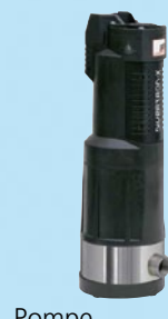
Pompe Divertron 1200