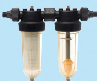
Kit Cintropur NW 25 Duo