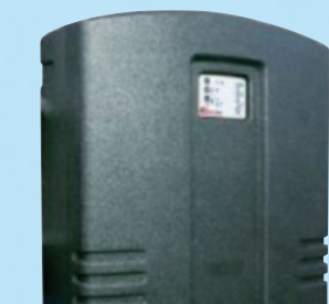
Gestionnaire Aquaprof TOP