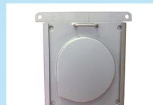
Régulateur de débit à effet vortex des eaux pluviales