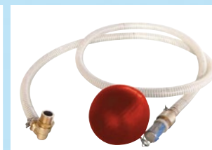
Kit de refoulement