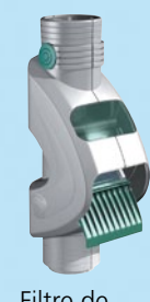
Filtre de gouttière